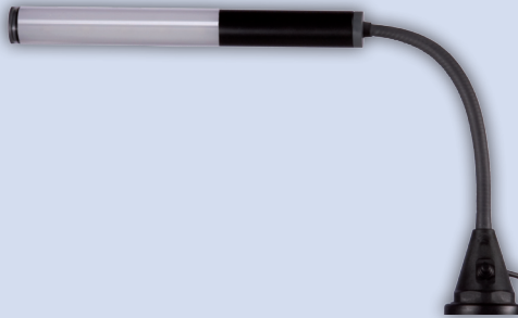
mit Magnet with magnet avec aimant met magneet

optional / optional / optionnel / optioneel